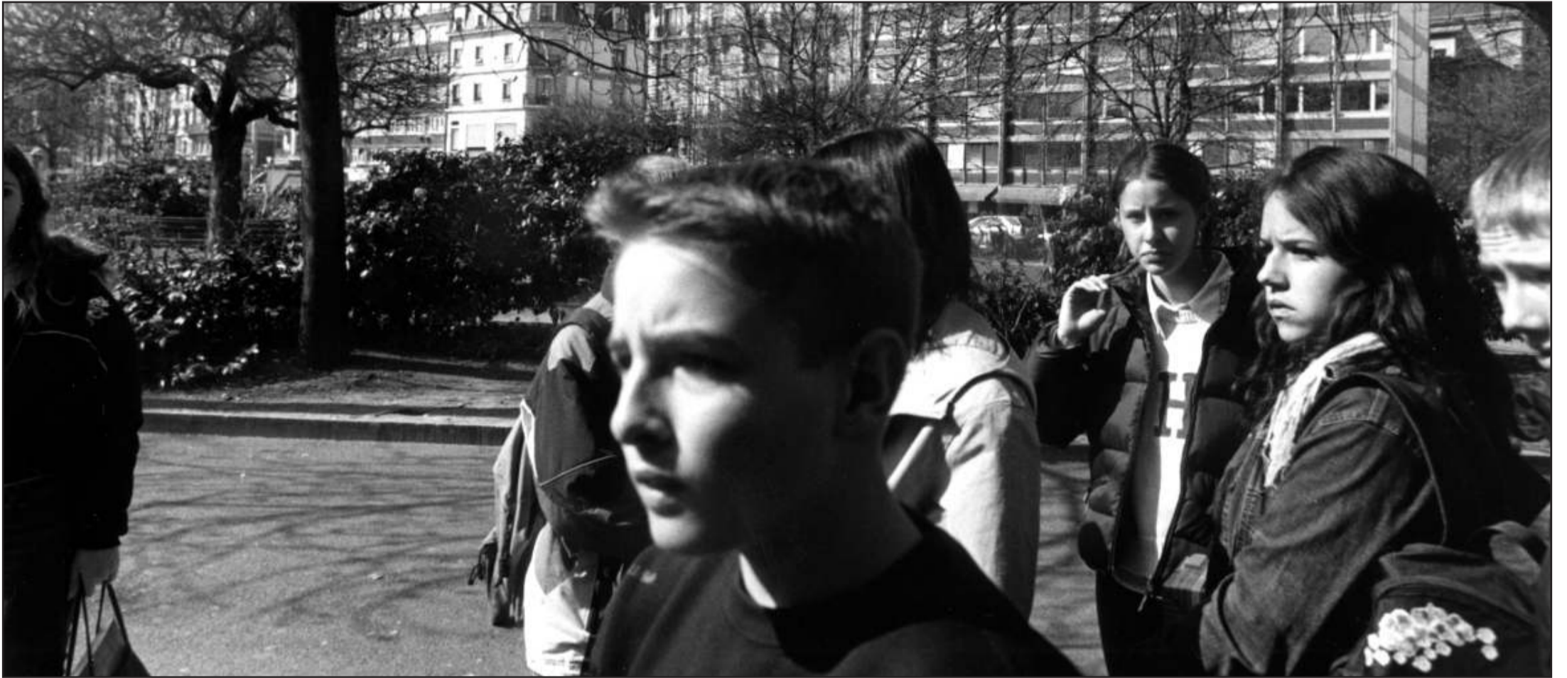
«Créer des sections, c'est afficher une hiérarchie des apprentissages, des élèves et des attentes.»

GENÈVE • Jusqu'à peu présente dans le débat sur le Cycle d'orientation, l'association «Former sans exclure», qui milite pour une école progressiste, ne se retrouve ni dans l'initiative ni dans le contre-projet soumis à votation. Eclairage.